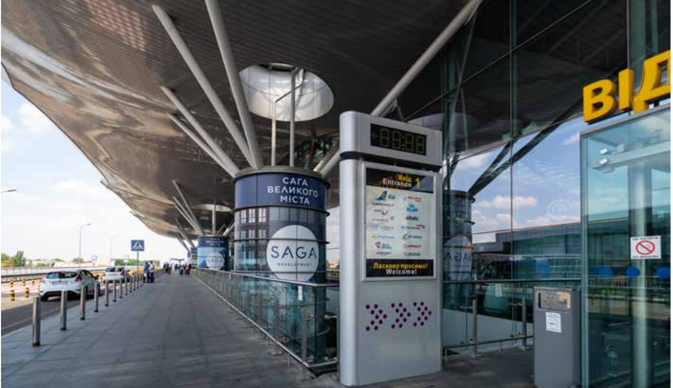
יזאלי השבת אנחנו באומן. שדה התעופה בוריספול בקייב