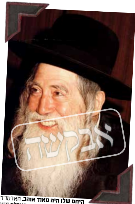
היחס שלו היה מאוד אוהב. האדמו"ר ר' יוחנן מערלוי זי"ע

הרגשתי כי משאלתי התגשמה לחלוטין. זכיתי להשתטח על ציון הרבי!! מכאן ואילך, מה שיהיה יהיה. יצאתי החוצה