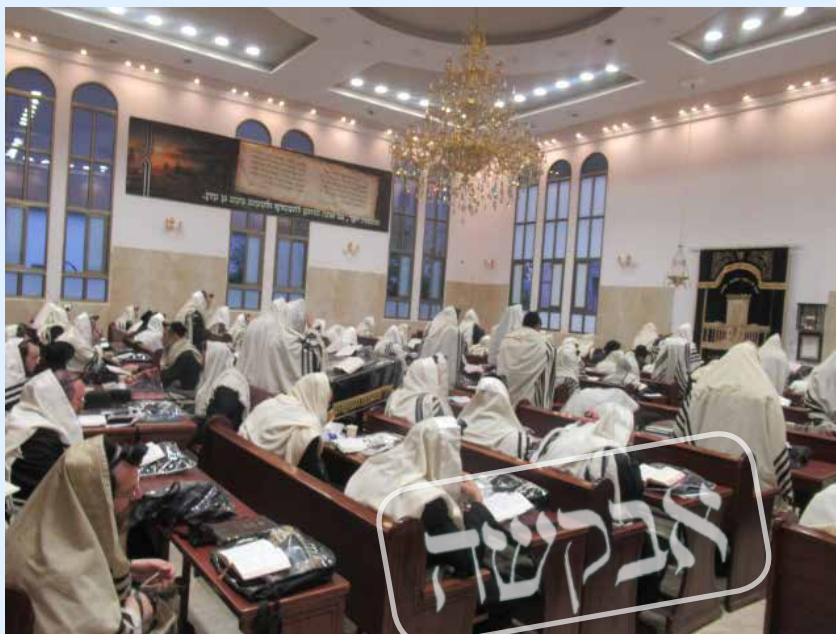
בשב"ק לא אמורים לנוח מהעבודות של יום שישי. התפילה בכוח בכולל 'חברים מקשיבים'

לכאורה מה ניתן לעשות אם הציבור אכן עייף? היכן נוכל לקבל 'כחור פלא' כדי לסלק את העייפות?