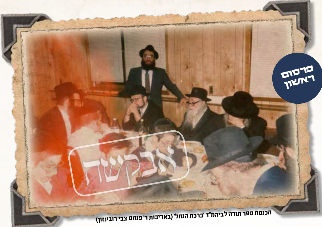
הכנסת ספר תורה לביהמ"ד 'ברכת הנחל'

בשלימות, ועל ידכם יתפשט אור ודעת רבינו ז"ל בעולם עדי נזכה לגאולתינו ופדות נפשינו בביאת משיחנו במהרה בימינו אמן.