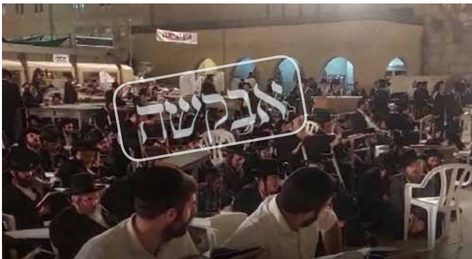
צריך רק לסדר את הזמן של השינה. אברכי אנ"ש מכלל הכוללי חצות באמירת תיקון חצות בסמיכות לשריד בית מקדשנו

מוהרנ"ת אומר על התבודדות שלעתיד זה יהיה דרך כבושה לרבים, ורואים גם בעניין הזה שלאט לאט זה נהיה נפוץ יותר ויותר. יש הרבה אנשים שרוצים לעזור לזה, והלואי שלכל אברך תהיה האפשרות ללמוד בכולל כזה