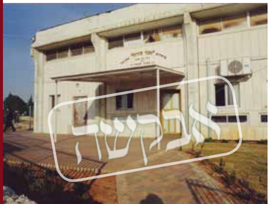
מתקיימים מניינים וסודרי לימוד. בית המדרש אור זורח בעמנואל

והתחלתי להסתובב אנה ואנה. פסעתי ברחוב פושקינא הלון וחזרו ולא ידעתי מה עלי לעשות, כיצד אצליח בשעה כה מאוחרת לחזור לקייב הבירה?