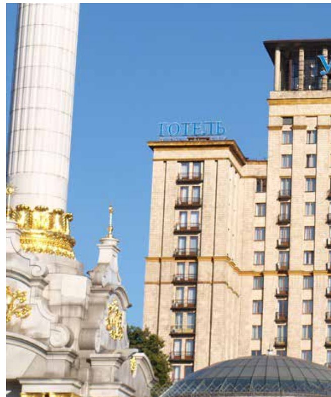
הגעתי כדי לטייל בקייב. בית מלון בעיר קייב