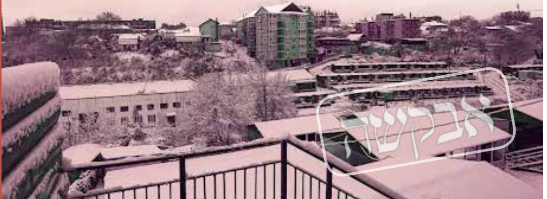
מבנה חד-קומתי אחד ישנו באומן, שם אין לאגנרל חורף' דריסת רגל. השלג בתקופת החורף באומן

"מאומן חזר יואלי בן אדם אחר לגמרי. עם 'אורות גבוהים' כמו שקוראים לזה..." עכשיו תורו של שמילי לספר. "מיד אחרי שהוא נחת, הוא חייג אלי בהתרגשות ואמר שאני חייב לבוא איתו לאומן... הוא אמר לי שאין עוד מקום כזה, ואני חייב לבוא לשם לחוות את זה מקרוב. העמדת יואלי על מקומו, והבהרת לי בצורה הכי ברורה שאני האחרון שיסע עכשיו לאומן... הייתי באותה תקופה רחוק לגמרי משמירת התורה, ניהלתי בית ללא שום סממן יהודי, לא שבת, לא כשרות, כלום! אז מה ההגיון לנסות לסחוב אותי לאומן?! הסברתי את זה ליואלי, והוא, שהבין שהוא עלה על מוקש,