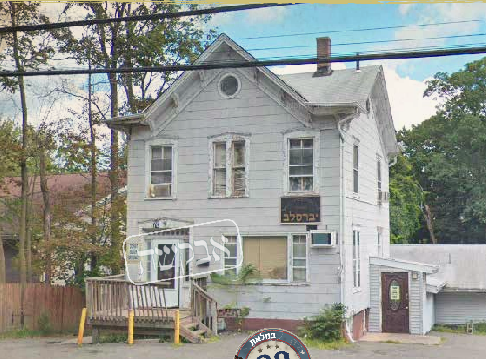
בית המדרש ברכת הנחל כיום