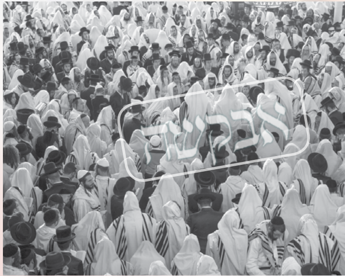
הציבור כולו מתחיל בניגון המרטיט של ראש השנה. התפילה בקלויז באומץ