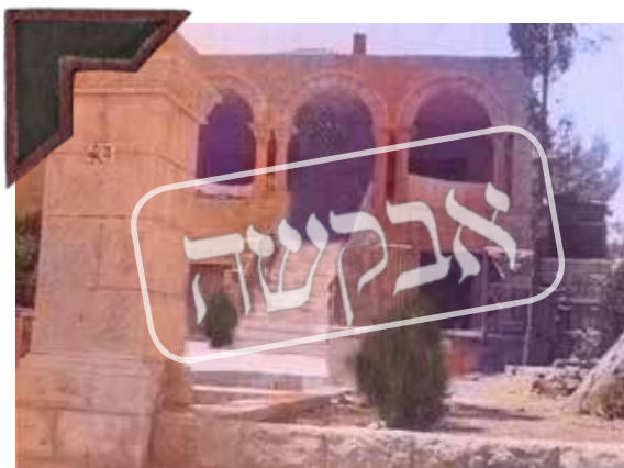
נחשב למקום מפואר. בית הכנסת אור אברהם בקטמן